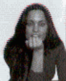
POR MARTA GARCÍA ALLER

¡OJO! NO SÓLO SABEMOS cuáles son Las Mejores Empresas para Trabajar , también hemos confirmado que tienen pensado contratar después del verano. Entre las 10 primeras hay objetos de deseo de múltiples sectores: telecomunicaciones, finanzas, consumo, farmacia, energía... Elija su favorito si quiere probar suerte. Para saber cuáles son, sólo hay que pasar página. El ranking exclusivo de Actualidad Económica revela un año más cuáles son las empresas más deseadas del país.